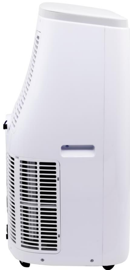
Seitenansicht mit Lüftungsgitter