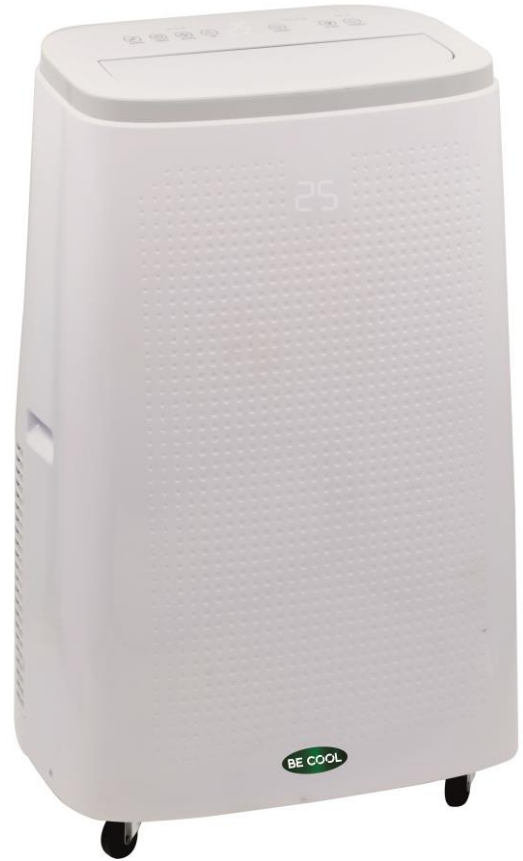
Frontansicht mit Laufrollen